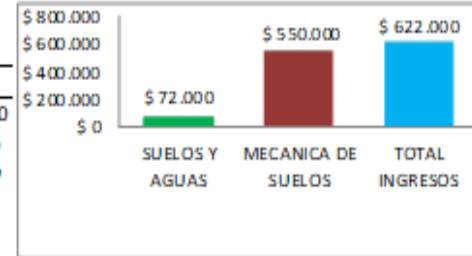
INGRESOS POR LABORATORIOS MES DE ENERO 2024