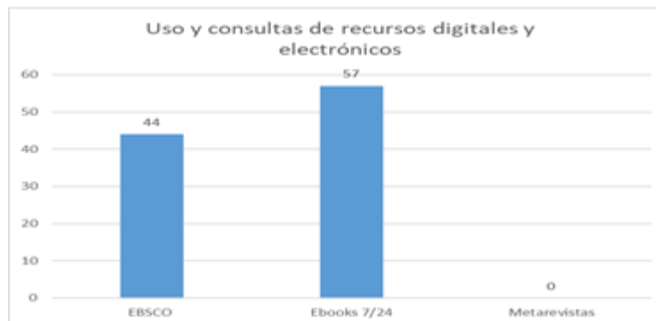
Gráfica 1. Elaboración propia.