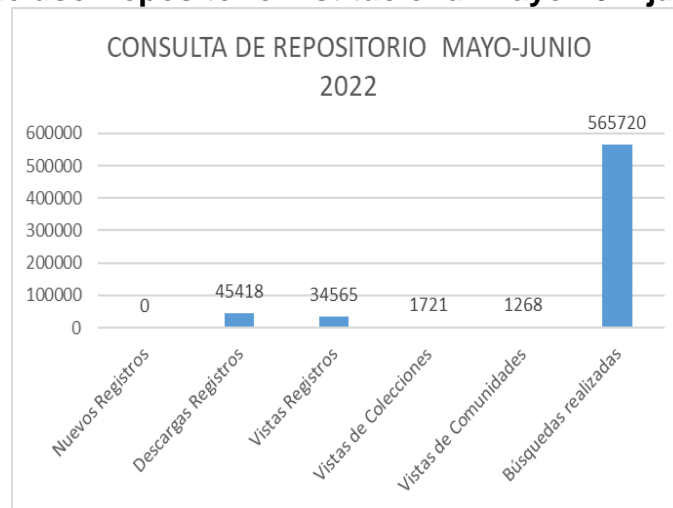
Gráfica 2. Elaboración propia.