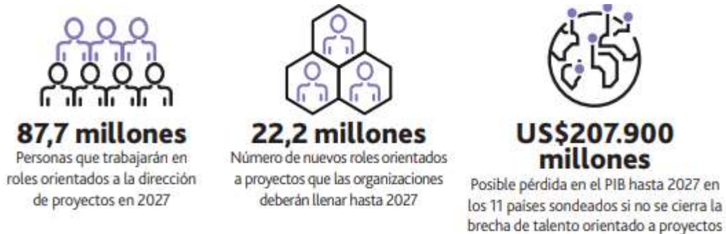
Gráfica 1. Demanda de empleos orientados a proyectos a nivel mundial