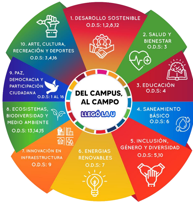
Esquema N°1: Ejes integradores Programa DEL CAMPUS, AL CAMPO . Extensión y Proyección Social en los Territorios.