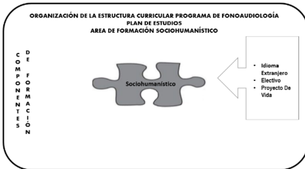
Figura 3. Componentes de formación del área Sociohumanística

Para el programa de Fonoaudiología, el idioma extranjero que se asume es el inglés, teniendo en cuenta que la mayor parte del material bibliográfico que fundamenta la disciplina se publica y comparte a través de este idioma.